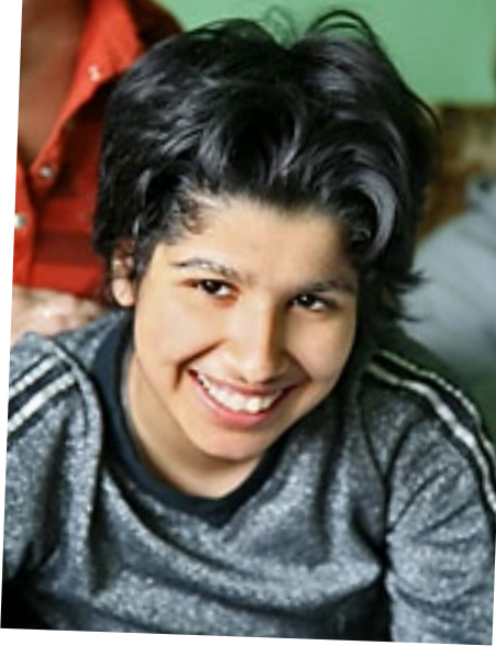
Flickan som gett namn till "Casa Silvia".

ska bli självständiga och så småningom stå på egna ben.