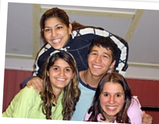
Ungdomarna trivs i FCE:s ungdomsgård "Klubben".

Det finns möjlighet att stödja denna verksamhet via ett speciellt konto.