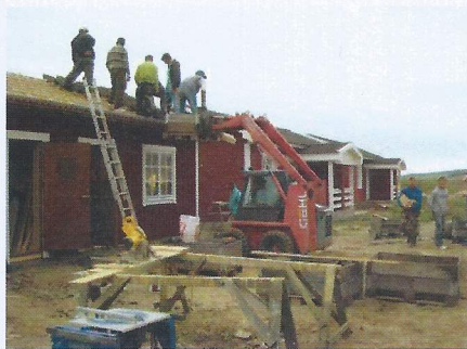
Volontärer från Sverige åker ständigt ner till Rumänien för att bygga hus och renovera fastigheter som EFI Fadder köpt.