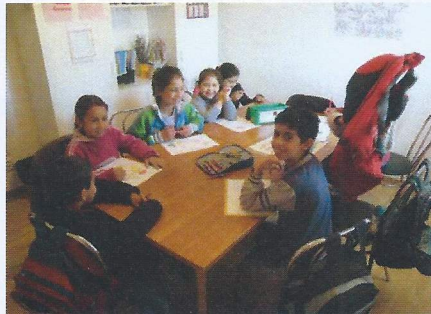
EFI Fadders senaste projekt är daglig läxhjälp för romska barn, en lokal lärare har anställts som hjälper barnen med skolarbetet.